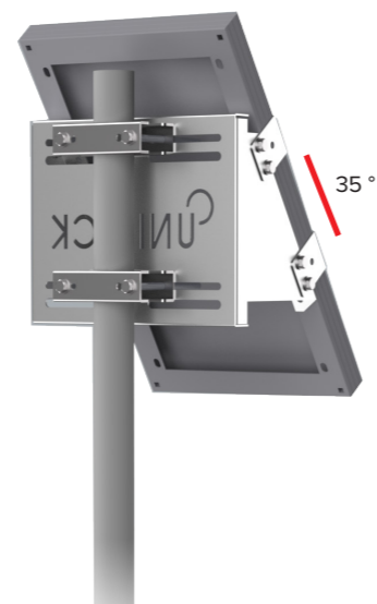
UNIFIX 20SF Per Unisun 10.12M/ 10.24M/ 20.12M/ 20.24M Orientamento verticale Cima e parte centrale del palo Flange di fissaggio opzionale Ref 1139