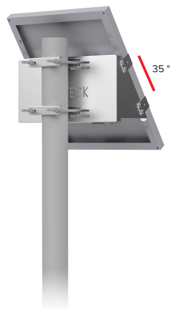
UNIFIX 50SF Per Unisun 30.12M/ 50.12M/ 50.24M/ 55.12BC Orientamento verticale Cima e parte centrale del palo Flange di fissaggio opzionale Ref 0064