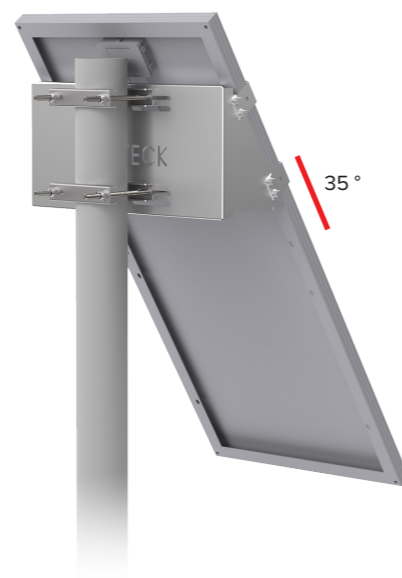
UNIFIX 100SF Per Unisun 80.12M/ 100.12M/ 100.24M/ 110.12BC Orientamento verticale Cima del palo Flange di fissaggio opzionale Ref 1146