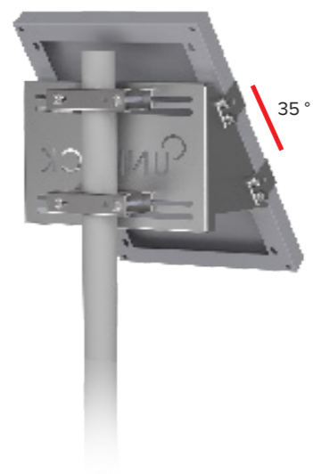
UNIFIX 5SF Per Unisun 5.12 M Orientamento verticale Cima e parte centrale del palo Flange di fissaggio opzionale Ref 2693