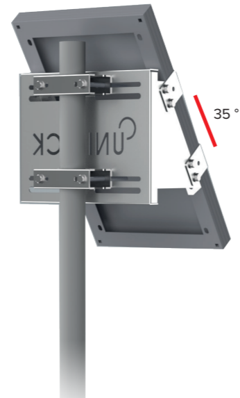
UNIFIX 20SF Pour Unisun 10.12M/ 10.24M/ 20.12M/ 20.24M Orientation portrait Tête et milieu de mât Brides de fixation en option Ref 1139