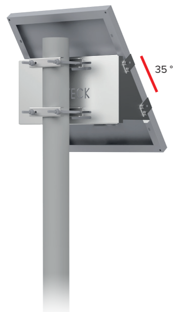
UNIFIX 50SF Pour Unisun 30.12M/ 50.12M/ 50.24M/ 55.12BC Orientation portrait Tête et milieu de mât Brides de fixation en option Ref 0064