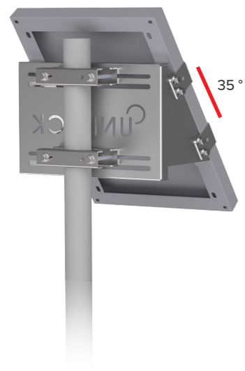
UNIFIX 5SF Pour Unisun 5.12 M Orientation portrait Tête et milieu de mât Brides de fixation en option Ref 2693